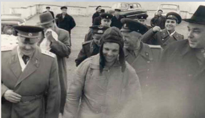
Гагарин в Куйбышеве после своего полёта

По словам очевидцев тех событий, в десятом часу 12 апреля космонавт был уже в Куйбышеве. В этот же день он прошёл медицинское обследование, доложил в Москву по телефону об успешном окончании полёта, затем пообедал и, по настоянию врачей, его сразу же отправили спать. Так что в день полёта пообщаться с Гагариным не удалось практически никому из посторонних. Вся информация